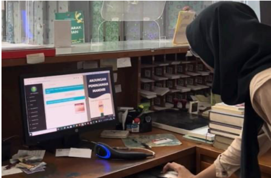
Gambar 2. Implementasi Otomasi Perpustakaan

Tahap awal implementasi SLiMS di Perpustakaan Politeknik Negeri Bandung diawali dengan kegiatan identifikasi kebutuhan layanan dan analisis kondisi sistem perpustakaan (lihat: Gambar 2 ). Kegiatan ini dilakukan melalui observasi langsung terhadap proses layanan sirkulasi, katalogisasi, dan manajemen anggota, serta diskusi antara pustakawan dan mahasiswa magang. Hasil analisis menunjukkan perlunya sistem otomasi yang mampu mengintegrasikan pengelolaan koleksi, layanan sirkulasi, dan akses informasi secara efisien. Berdasarkan kebutuhan tersebut, SLiMS dipertahankan dan dioptimalkan sebagai sistem otomasi utama karena bersifat open-source dan fleksibel dalam pengembangan layanan.