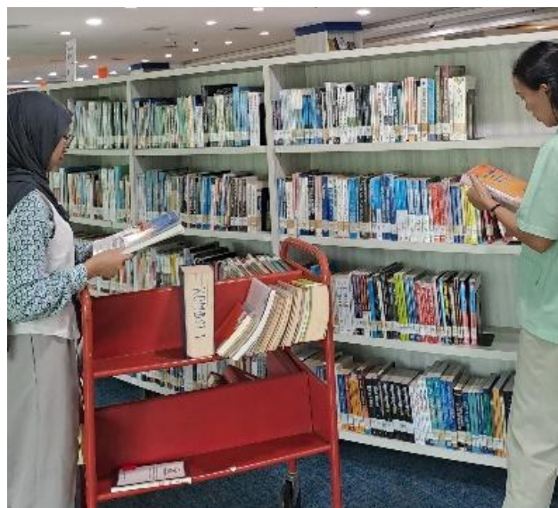
Gambar 2. Shelving

Proses pengolahan bahan pustaka meliputi penginputan informasi penting, seperti nomor aset, nomor induk, serta daftar bibliografi yang mencakup detail mengenai judul, penulis, penerbit, tahun terbit, dan informasi lain yang relevan (lihat: Gambar 1 ). Penginputan ini dilakukan secara sistematis untuk memudahkan identifikasi dan pelacakan koleksi di masa mendatang. Selain itu, inventarisasi buku juga bertujuan untuk memberikan kode unik pada setiap koleksi (dengan menempel RFID serta tagging dan encode ) sehingga meminimalkan risiko duplikasi data atau kehilangan bahan pustaka. Tahapan ini menjadi landasan bagi proses-proses berikutnya, seperti klasifikasi dan katalogisasi, yang pada akhirnya memungkinkan pemustaka untuk dengan mudah menemukan bahan pustaka yang mereka butuhkan melalui sistem pencarian perpustakaan.