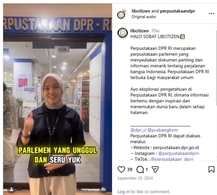
Gambar 5. Postingan Promosi Perpustakaan

Promosi perpustakaan merupakan salah satu kegiatan penting untuk meningkatkan kesadaran masyarakat terhadap layanan dan koleksi yang tersedia. Semua konten promosi yang dibuat didistribusikan melalui platform media sosial, yaitu akun Instagram @libcitizen dan @perpustakaan DPR. Konten yang dihasilkan dirancang secara kreatif dan informatif untuk menjangkau audiens yang lebih luas, sekaligus memperkuat citra perpustakaan sebagai pusat informasi dan pembelajaran.