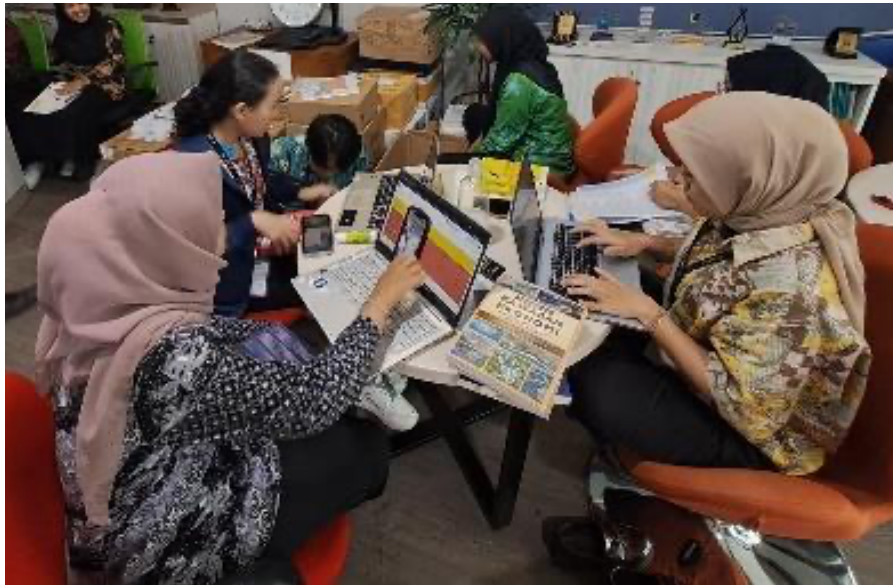
Gambar 1. Pengolahan bahan pustaka

Proses pengolahan bahan pustaka meliputi penginputan informasi penting, seperti nomor aset, nomor induk, serta daftar bibliografi yang mencakup detail mengenai judul, penulis, penerbit, tahun terbit, dan informasi lain yang relevan (lihat: Gambar 1 ). Penginputan ini dilakukan secara sistematis untuk memudahkan identifikasi dan pelacakan koleksi di masa mendatang. Selain itu, inventarisasi buku juga bertujuan untuk memberikan kode unik pada setiap koleksi (dengan menempel RFID serta tagging dan encode ) sehingga meminimalkan risiko duplikasi data atau kehilangan bahan pustaka. Tahapan ini menjadi landasan bagi proses-proses berikutnya, seperti klasifikasi dan katalogisasi, yang pada akhirnya memungkinkan pemustaka untuk dengan mudah menemukan bahan pustaka yang mereka butuhkan melalui sistem pencarian perpustakaan.