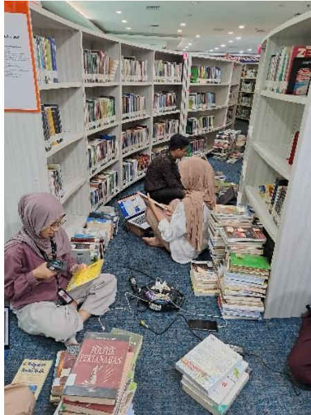
Gambar 3. Stock Opname

Selanjutnya terdapat proses shelving . Buku atau bahan pustaka lain yang telah dipinjam atau digunakan oleh pengunjung dikembalikan ke rak yang sesuai (lihat: Gambar 2 ). Ini melibatkan penempatan buku berdasarkan sistem klasifikasi perpustakaan yang digunakan, yaitu Dewey Decimal Classification (DDC). Shelving penting untuk menjaga agar koleksi perpustakaan tetap teratur, sehingga memudahkan pengunjung menemukan bahan pustaka yang mereka butuhkan (Sifahumaria, 2025).