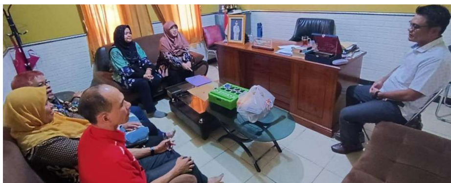
Gambar 2. Tahap Analisis Kebutuhan Desa Campaka Terkait Kekerasan Dalam Rumah Tangga

Tahap persiapan diawali dengan kunjungan ke Desa Campaka pada tanggal 5 Juni 2024, yakni diskusi dengan Kepala Desa Campaka terkait analisis kebutuhan di lapangan (lihat Gambar 2 ) serta hal-hal yang menjadi latar belakang kegiatan PKM Desa Binaan.