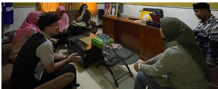
Gambar 3. FGD bersama dengan Kepala Desa, Ketua PKK dan perangkat Desa Campaka

Kegiatan dilanjutkan pada tanggal 27 Juni 2024. Tim PKM berdiskusi dengan Kepala Desa Campaka, Ibu Ketua PKK Desa Campaka, serta perangkat desa yang terkait dengan kegiatan ini.