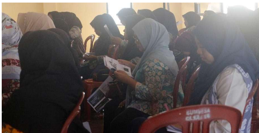
Gambar 4. Tahap Pelaksanaan Kegiatan ketika Peserta Menyimak Penyampaian Materi

Kegiatan utama dilaksanakan pada tanggal 6 Agustus 2024, mulai pukul 08.00 hingga pukul 12.00. Kegiatan dimulai dengan mengarahkan para peserta untuk mengisi kuesioner pre-test terlebih dahulu. Dilanjutkan dengan pemaparan materi dan sesi tanya jawab yang dipandu oleh tiga narasumber dan satu moderator (lihat Gambar 4 ).