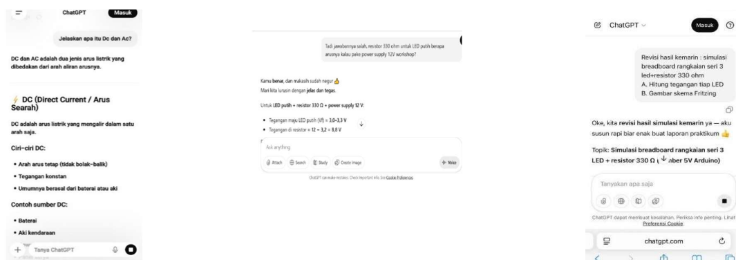
(A). Level III Mechanical (B). IVA-IVB Routine-Refinement (C). V-VI Integration-Renewal